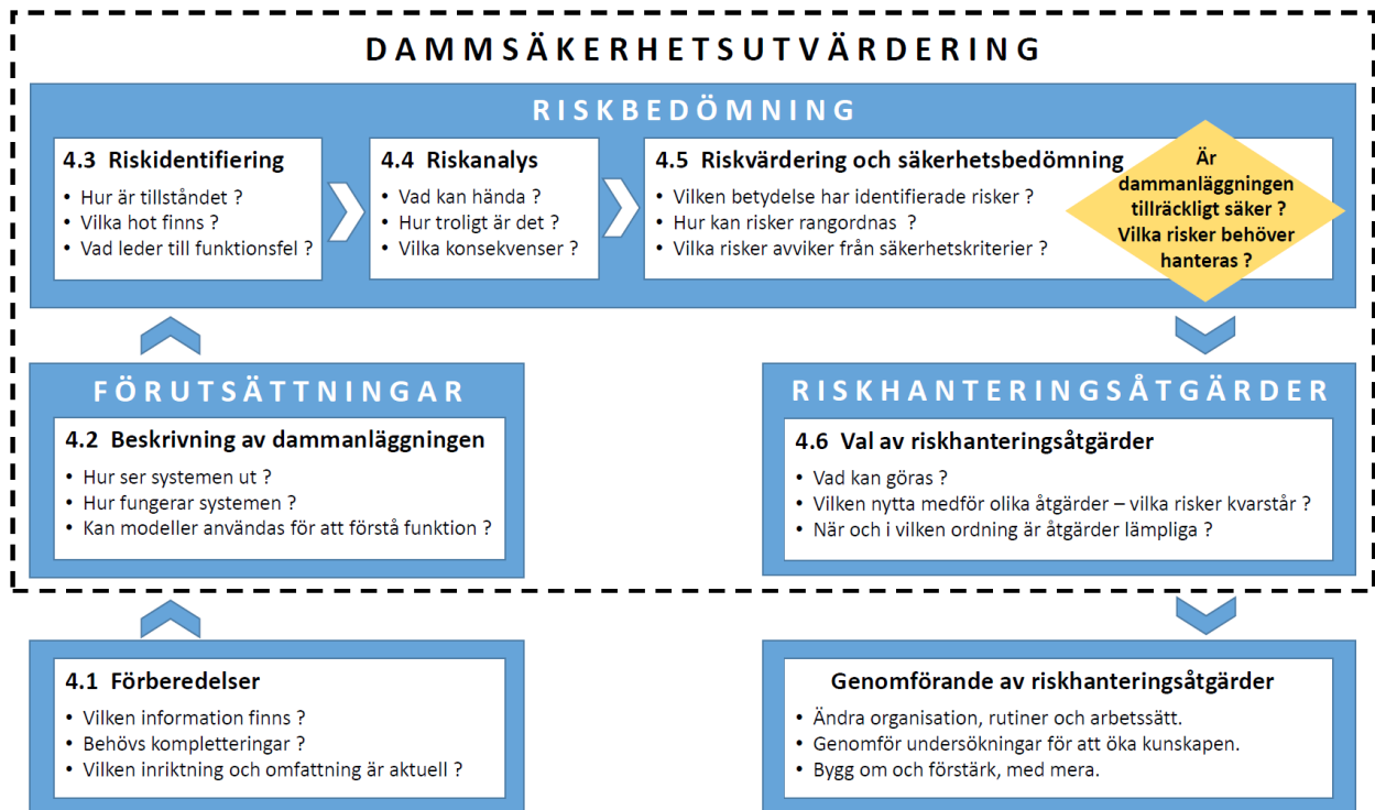
Figur 2. Dammsäkerhetsutvärdering – steg och frågeställningar.