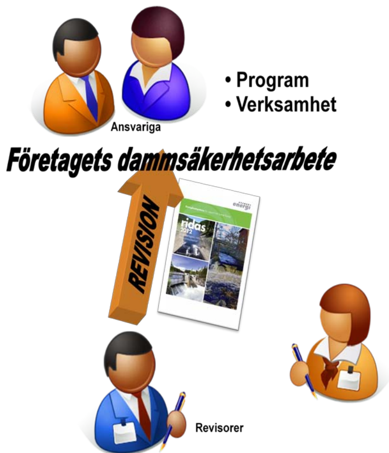
Figur 2 Att dammsäkerhetsarbetet bedrivs i enlighet med dessa riktlinjer prövas vid revisioner av företag som äger eller förvaltar dammar i konsekvensklass 2 eller högre.

Revisorererna rapporterar till Svensk Energi.